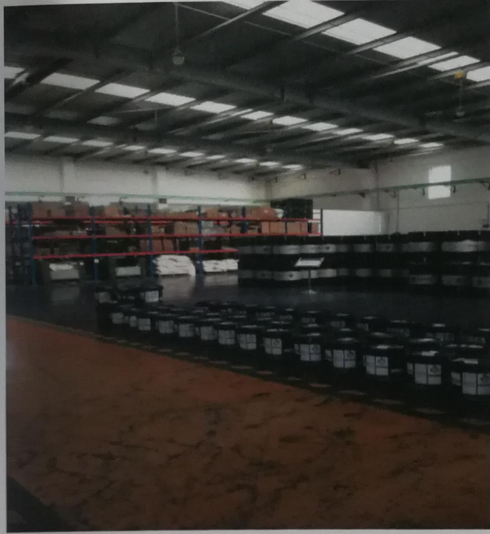
原料仓库 其 VOCs 值 200PPb 左右